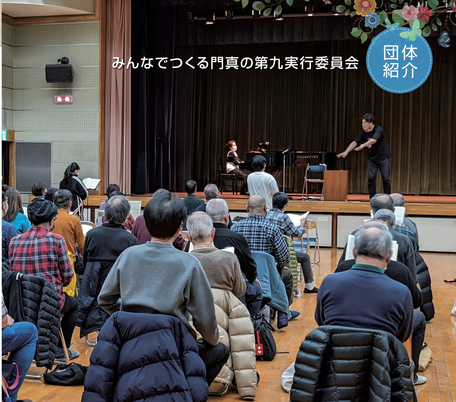
令和4年1月9日、門真市立公民館でのレッスン中にお話を伺いました。